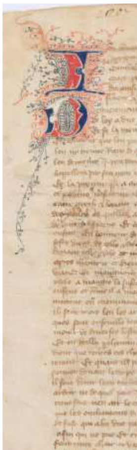
Úvodní stránka francouzské verze (Vatican, Biblioteca Apostolica Vaticana, Ott. Lat. 2207, f. 1r.)