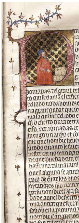
Stránka aragonské verze katalánského rukopisu (Madrid, Real Biblioteca de l'Escorial, Z. I. 2, f. 58r.)