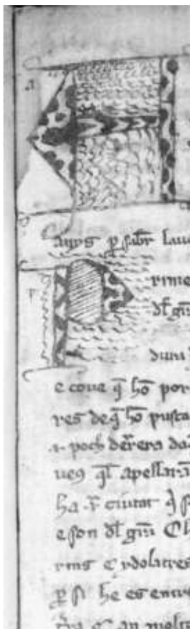
Úvodní stránka katalánské verze (Florence, Biblioteca Riccardiana, Ricc. 2048, f. 1r.)

Hodoric/Odorich. A mají mnoho relikvií, které odvezl do Tany, kde Bůh učinil mnoho zázraků.« (Zde je ve všech třech rukopisech chyba, protože Odorik ostatky naopak vezl z Thány do Zajtonu, kde je uložil v jednom ze zmíněných františkánských sídel. – O umučení čtyř františkánů v indické Tháně viz Sněženka listopad a prosinec 2023)