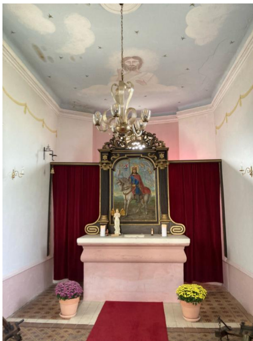
Z farního výletu. Kaple ve Vonoklasech.