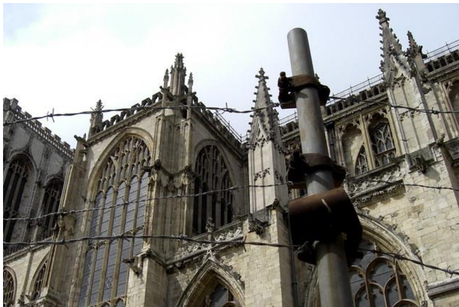
Craig Booth: York Minster

Jestliže máte k adoraci tak snadný přístup, že tam totiž dojedete autem anebo to dokonce máte ke kostelu kousek pěšky, pak poznáte, do jaké míry tuto možnost považujete za samozřejmost. Jsou lidé, kteří by velmi rádi strávili při adoraci čas s Ježíšem, ale nemohou se hnout z domova, jsou nemocní anebo zcela zaneprázdněni péčí o děti. Pak jsou na světě také ti, kteří pro Eucharistii riskují svůj život v místech, kde jsou pro svou víru pronásledováni. Když pomyslíte na ty, kteří chodí pěšky několik hodin nebo i dní, aby mohli být s Ježíšem ve svátosti, dojde vám, že máme veliký dar. Tím je už jen to, že se můžeme svobodně modlit, nebo že máme kněze, který nám uděluje svátosti.