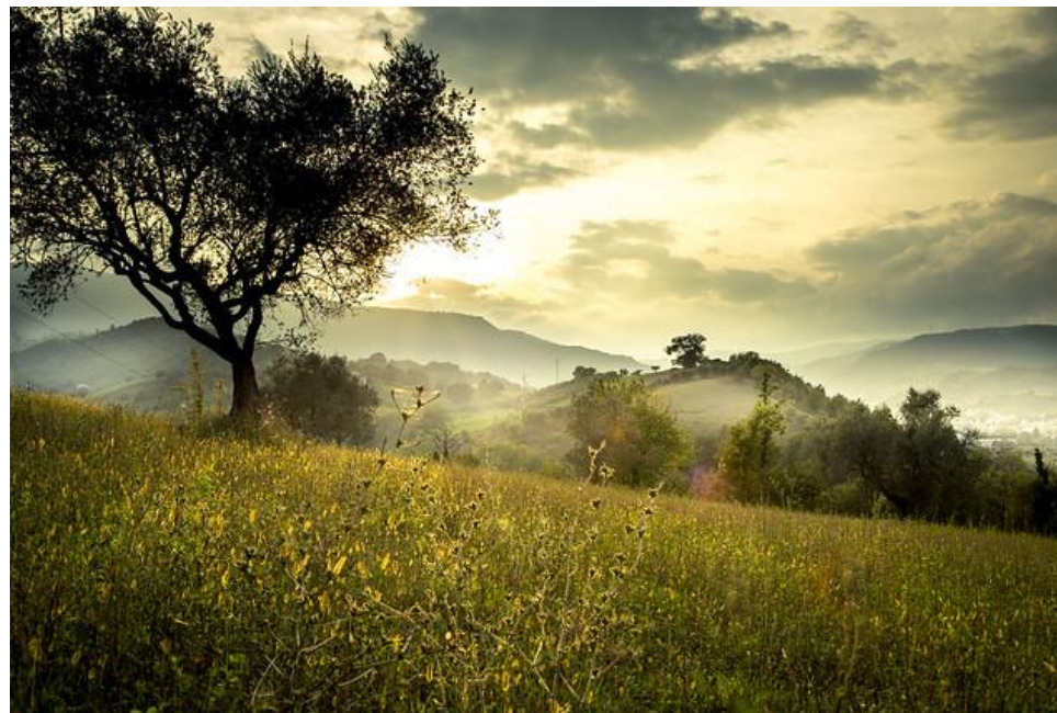
Rino Peroni: Landscape

Atmosféře ticha v kapli nebo kostele, vůni kadidla a nádheře monstrance se nic nevyrovná a všechno dohromady nám to má pomoci pochopit podstatu adorace. Jsme skutečně před Ježíšem Kristem, jeho tělem, krví, duší a božstvím. Čím více se noříme do tohoto ticha před Nejsvětější Svátostí, tím více si uvědomujeme, že naší reakcí může být jedině údiv a úžas nad velikostí našeho Boha.