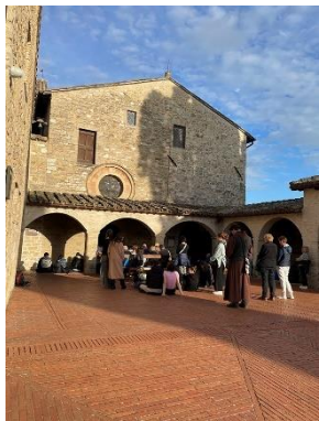
Kostel sv. Damiána

„Jděte a kažte, že se přiblížilo Království nebeské. Zadarmo jste dostali, zadarmo dejte. Neberte od nikoho zlato, stříbro ani měďáky do opasků, neberte si na cestu ani mošnu, ani dvoje šaty, ani hůl... Když přijдете do domu řekněte: ‚pokoj vám.‘“ Františka tato slova ohromila. Najednou věděl, kde je jeho místo. Vzal si prostý, hrubý šat, opásal se provazem a stal se putujícím kazatelem.