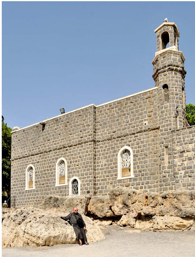
Na té skále zbuduji svou církev (srov. Mt 16,18)

to hora Tábor. Až druhý den jsem zjistil, že je to jen nějaký bezvýznamný kopec. Ale může být ve Svaté zemi něco bezvýznamného? Takže zase příště.