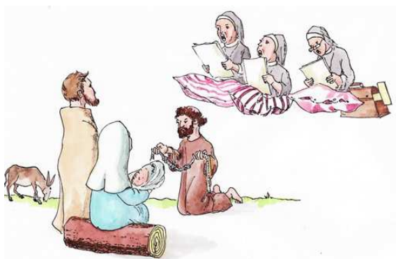
Obrázek z výstavy "Františkánské úsměvy"