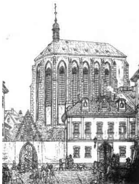
Kostel na kresbě Viléma Morstadta (polovina 19. století)

Kromě dnešního večera jsme pro vás na další dny připravili ještě následující program ve Farním klubu (vchod do Klubu najdete vlevo cestou z Jungmannova náměstí do Františkánské zahrady).