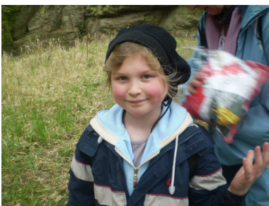
Byli s námi i zástupci ministrantů